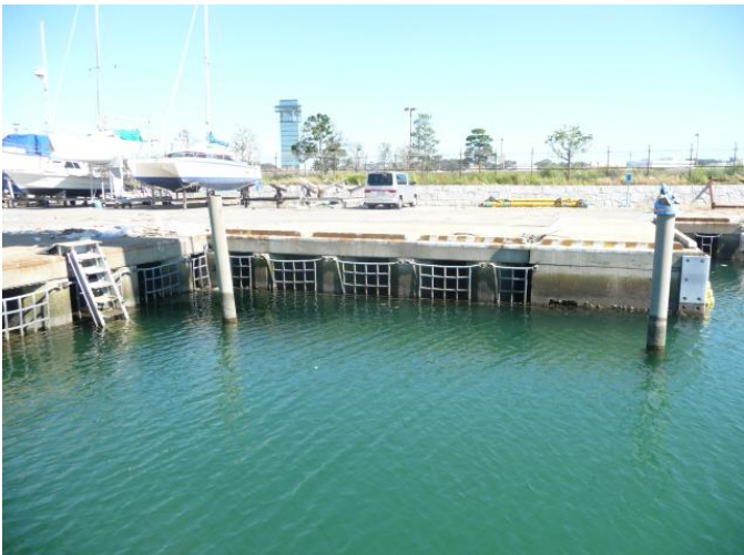
クレーン棧橋仮設工事: 施工前