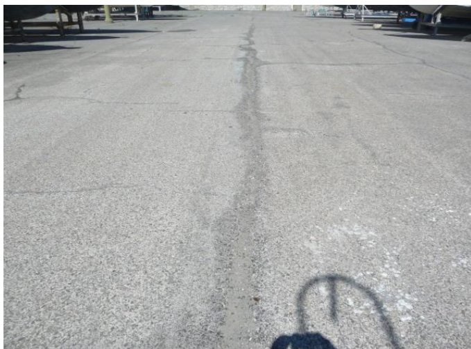
ヤード周辺の舗装仮復旧工事: 施工前