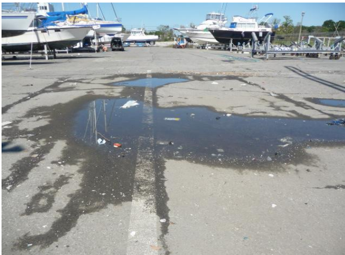
クレーン周辺の舗装仮復旧工事: 施行前