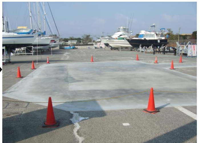
クレーン周辺の舗装仮復旧工事: 施行後