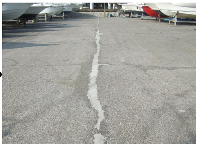
ヤード周辺の舗装仮復旧工事: 施行後