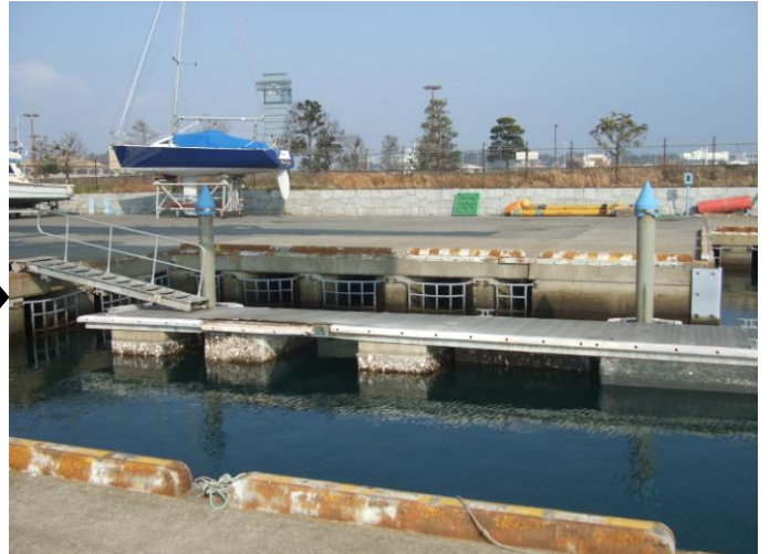
クレーン棧橋仮設工事: 施工後